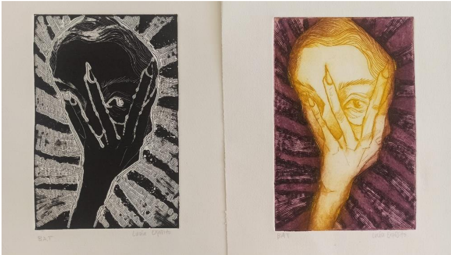
Trabajos de alumnos de 2º curso de la Facultad de Bellas Artes de Sevilla

Tamaño DIN A3 .- Trabajo con herramientas eléctricas y decapante Estampación en hueco. Variaciones.