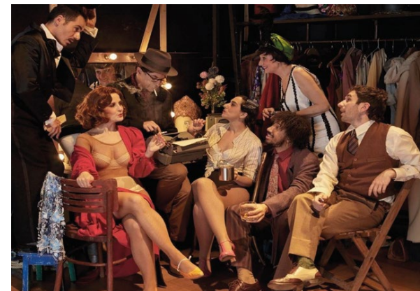
Mihura. El último comediógrafo.