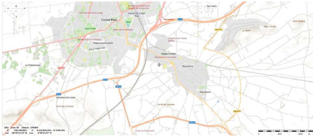
Redes de Carreteras y ferrocarril

La creación del campus universitario de Ciudad Real (1985), como parte de la (UCLM 1982), y la instalación de una estación con parada del TAV o AVE en su línea Madrid-Sevilla (1992), han contribuido a intensificar los flujos de conexión con la red de ciudades españolas y a la descentralización de Madrid dando numerosas oportunidades a diversos sectores económicos, profesionales y educativos. El factor ferroviario unido al desarrollo de autovías en nuestro entorno, A-43, A-41 y CM-45, a inducido a un crecimiento de la actividad que centraliza la comarca incluso en ámbitos superiores como el provincial y el regional.