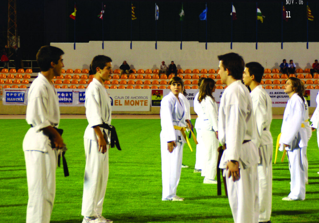
Fiesta de inauguración del Polideportivo Municipal Juan Carlos I

El campo se inauguró en 1973 y en sus 33 años de existencia no había conocido reforma alguna. Aún falta acometer la segunda fase, que en un par de meses estará finalizada, referente a la dotación electrónica e infraestructura interior de las oficinas. El nuevo espacio fue inaugurado el pasado cuatro de octubre en un acto que conjugó deporte, alegría y diversión.