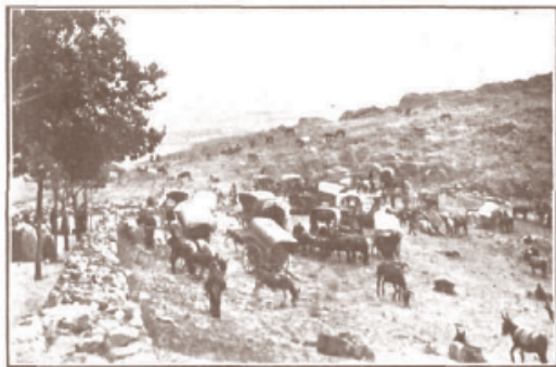
Vista parcial de la romería.