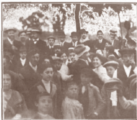
Grupo de romeros bailando en las huertas de la Poblachuela.