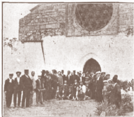
Una de las puertas y ventana árabe que se conserva en la Ermita.